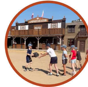
zabawa rodem z Dzikiego Zachodu