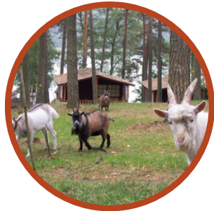
wizyta w mini ZOO