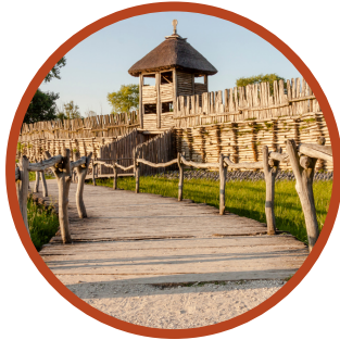
spotkanie z historią